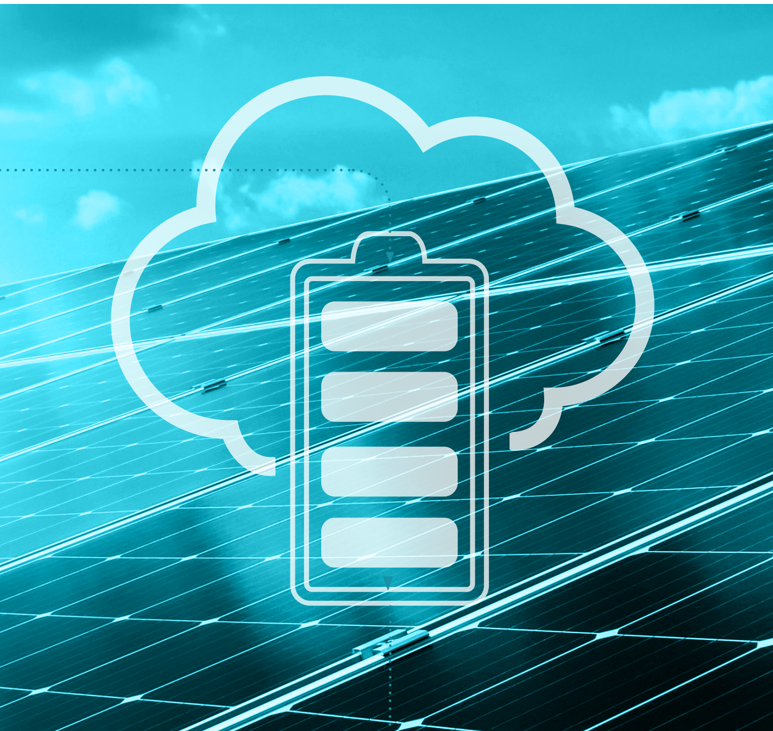
MKI-0022-3 valées MySmartBattery-V1